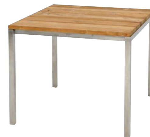
リクレイドテーブル90×90 Reclaimed Table 90×90 W900×D900×H755mm フレーム/ステンレス 天板/チーク 重量/28.5kg 組立式 ¥253,000(本体価格 ¥230,000)