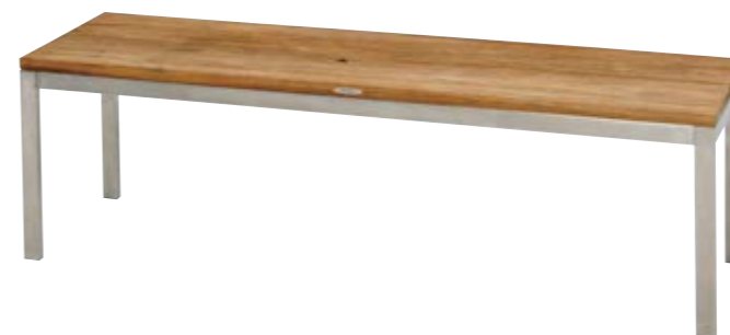
リクレイドフラットベンチ1500 Reclaimed Flat Bench 1500 W1,480×D400×H455mm フレーム/ステンレス 座/チーク 重量/18.3kg 組立式 ¥253,000(本体価格 ¥230,000)