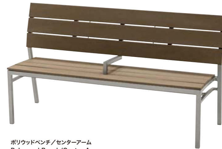
ポリウッドベンチ/センターアーム Polywood Bench/Center Arm W1,500×D530×SH410・H800mm フレーム/アルミ 背・座/ポリエチレン 重量/14.5kg センターアーム着脱可能 ¥231,000(本体価格 ¥210,000)