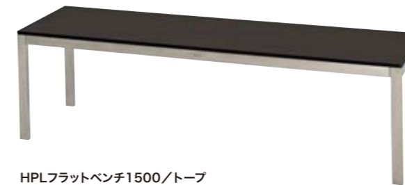
HPLフラットベンチ1500/トープ HPL Flat Bench 1500/Taupe W1,480×D400×H450mm フレーム/ステンレス 座/HPL 重量/17.6kg 組立式 ¥198,000(本体価格 ¥180,000)