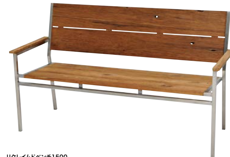
リクレイドベンチ1500 Reclaimed Bench 1500 W1,550×D615×SH450・H900mm フレーム/ステンレス 背・座/チーク 重量/34.2kg ¥352,000(本体価格 ¥320,000)