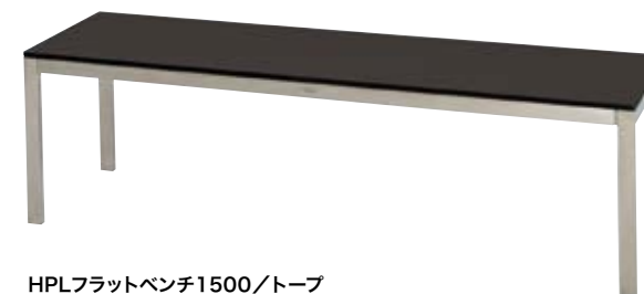
HPLフラットベンチ1500/トープ HPL Flat Bench 1500/Taupe W1,480×D400×H450mm フレーム/ステンレス 座/HPL 重量/17.6kg 組立式 ¥198,000(本体価格 ¥180,000)