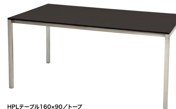
HPLテーブル160x90/トープ HPL Table 160x90/Taupe W1,600×D900×H745mm フレーム/ステンレス 天板/HPL 重量/37.0kg 組立式 ¥330,000(本体価格 ¥300,000)

HPL=High Pressure Laminateの略 樹脂含浸紙を加熱、高圧でプレスした積層板 表面の硬度が高くキズにつよく、耐熱、耐水性 にすぐれています。