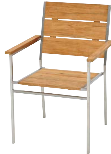
リクレイドアームチェア Reclaimed Armchair W610×D615×SH450・H900mm フレーム/ステンレス 背・座/チーク 重量/11.2kg ¥121,000(本体価格 ¥110,000)